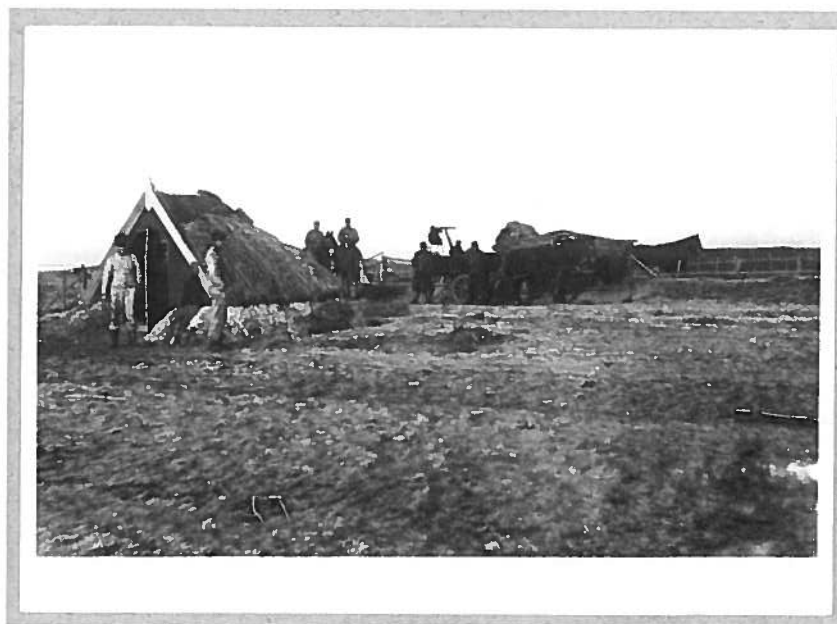
Ned med våbnene 2. April 1914 - Steen Bille Larsen