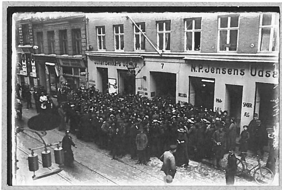
Ned med våbnene 2. April 1918 - Steen Bille Larsen