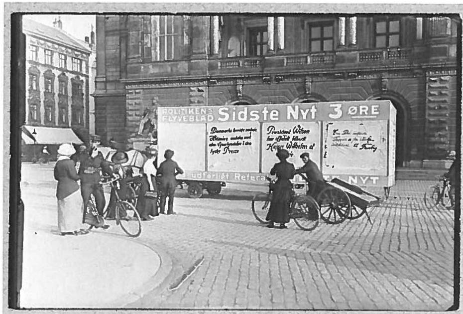
Ned med våbnene 2. April 1914 - Steen Bille Larsen