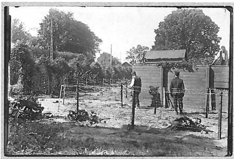
Ned med våbnene 2. April 2014 - Steen Bille Larsen