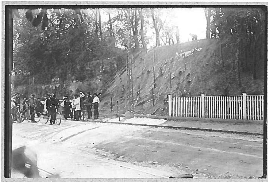
Ned med våbnene 2. April 1914 - Steen Bille Larsen