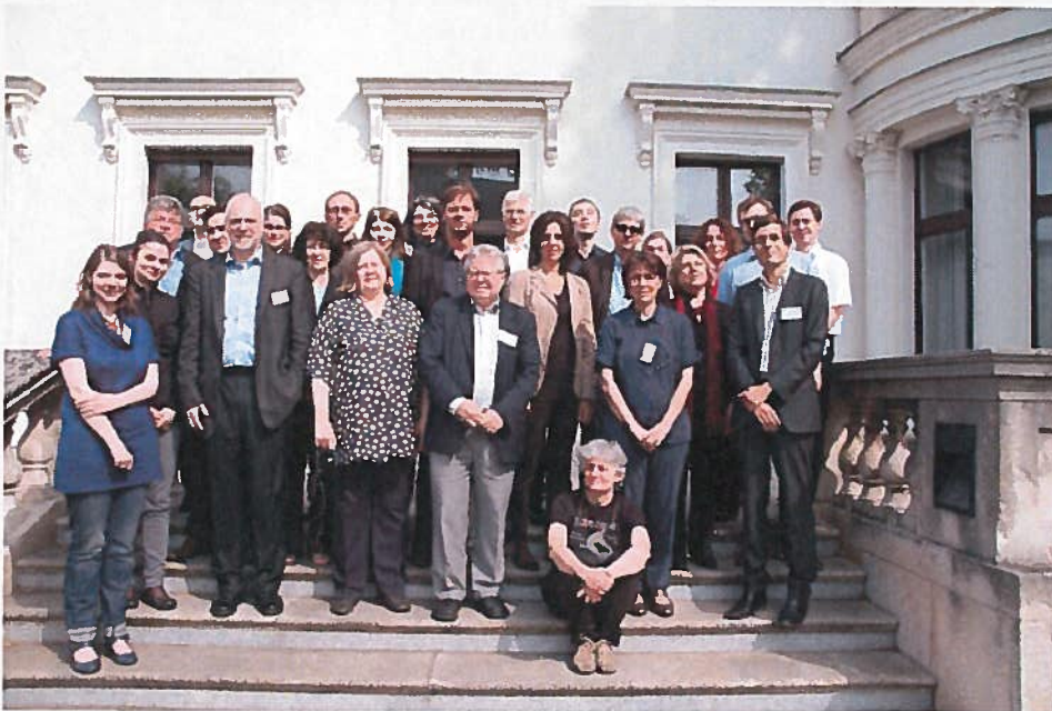
Kick-off meeting Europeana 1914-1918